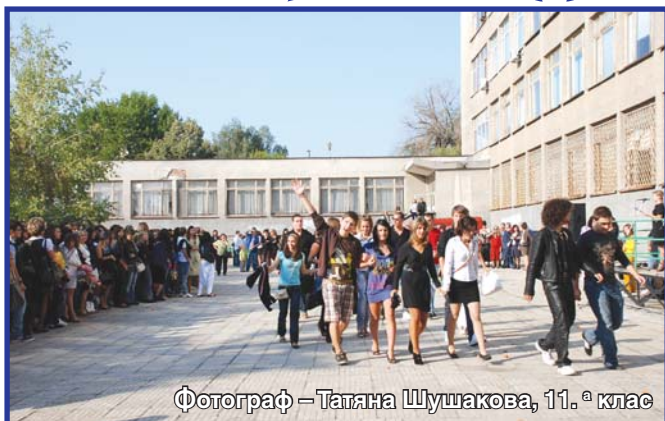
Фотограф – Татяна Шушакoва, 11.ª клас