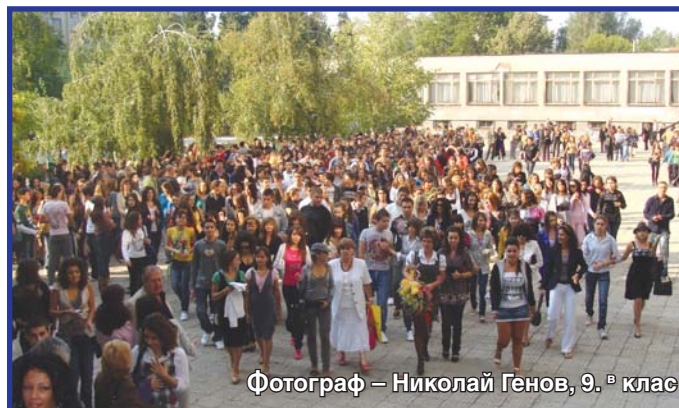
Фотограф – Николай Генов, 9.ª клас